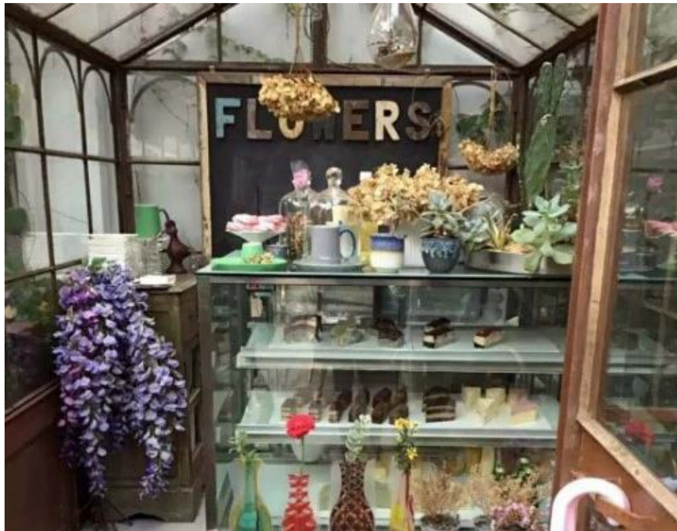
設計像溫室花園的咖啡店。

這類時尚化的新式簡餐，主要以西式餐飲為主，配合店內的外國風情環境，讓消費者有一種「購買了輕奢產品」的感覺。