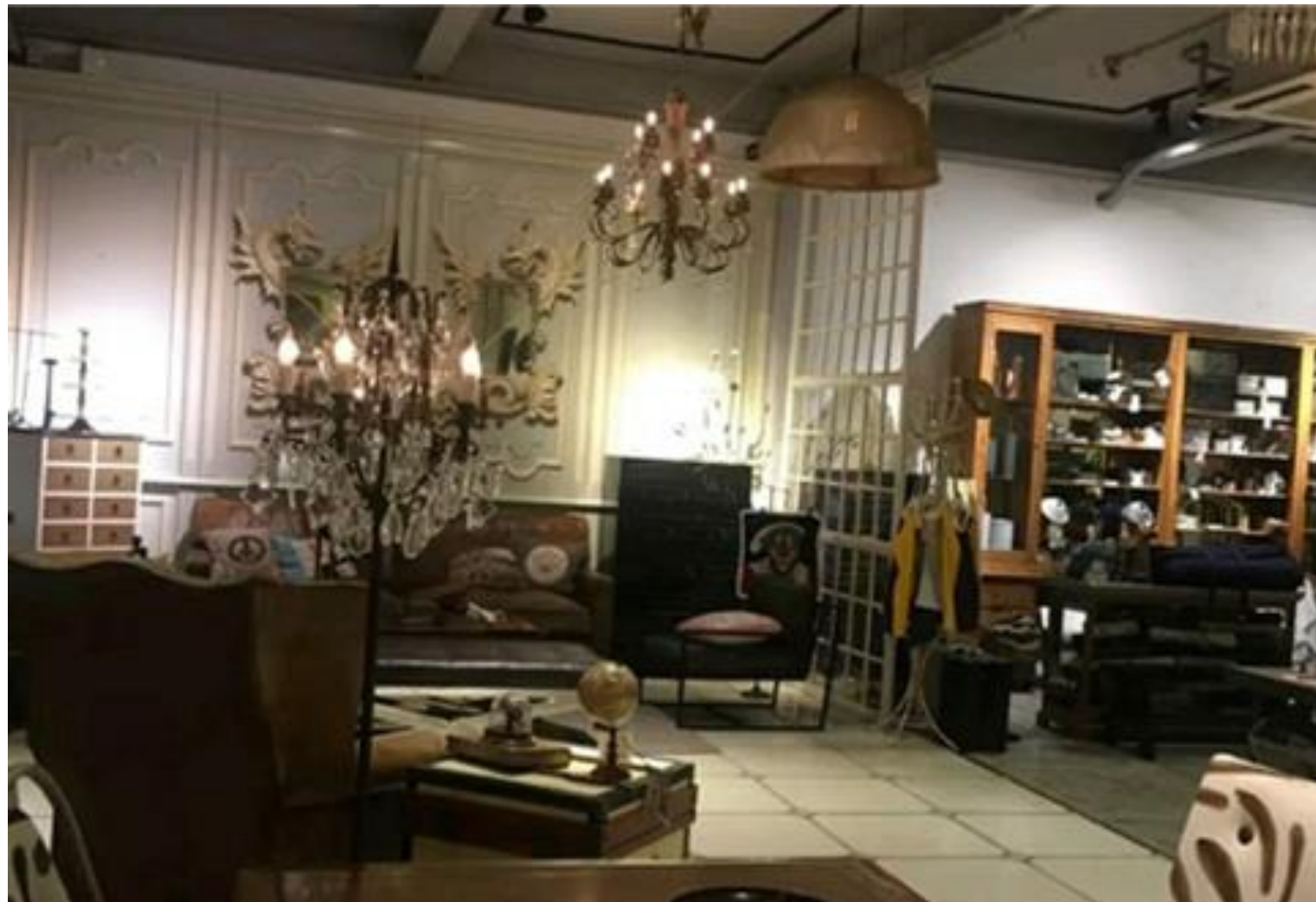
以書室為主題的咖啡店。

亦隨著內地消費者對餐飲的需求特徵開始細分化，港商須把握箇中契機，才能成功拓展內地市場。